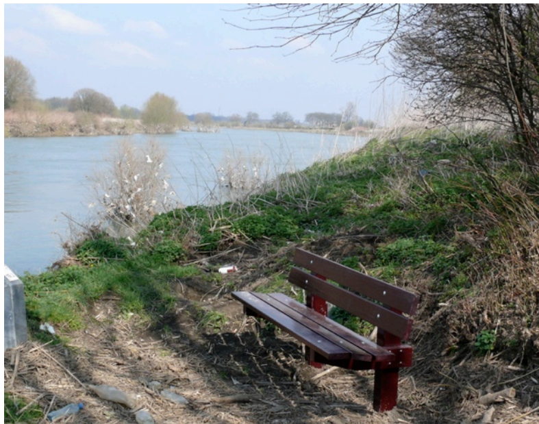
Bank met uitzicht

De dorpsraad had gevraagd om onder aan de betonnen randen van de wegversmallingen reflectoren te zetten zodat de wegversmallingen toch zichtbaar zijn ook al zijn de paaltjes eraf. De fabrikant gaat eerst proberen om ervoor te zorgen dat de paaltjes niet zo maar eruit gehaald kunnen worden.