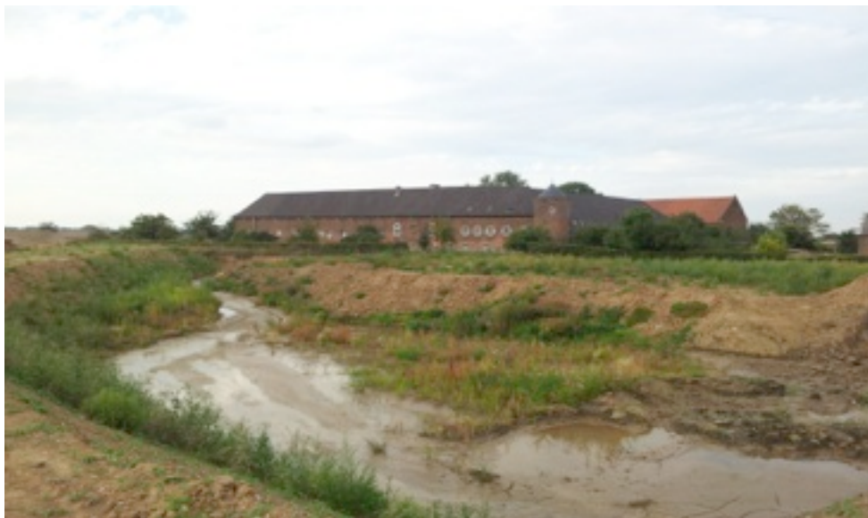
Kringloop Hartelstein Hartelstein 204 6223 HV Maastricht Itteren

En graag zien we jullie terug in Onze Winkel